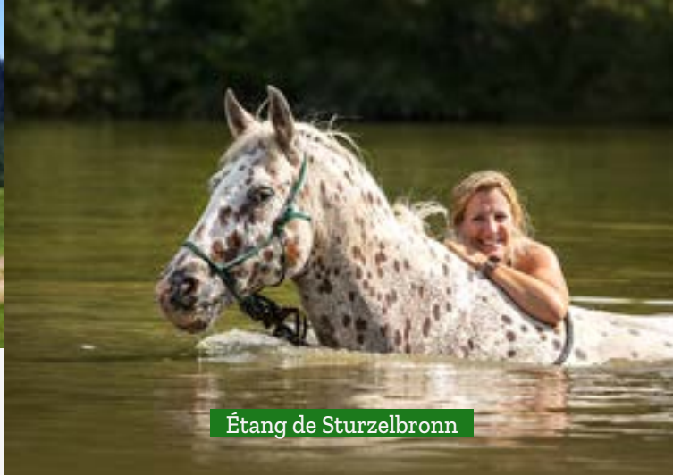
Étang de Sturzelbronn

Vivez votre passion à la conquête de l'Alsace et de la Moselle