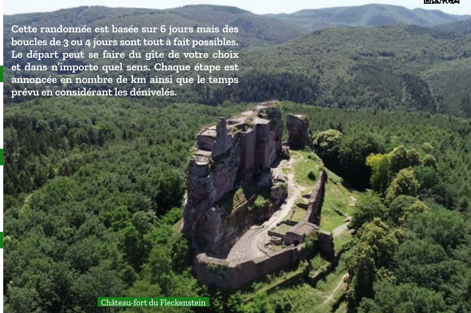
Château-fort du Fleckenstein

Cette randonnée est basée sur 6 jours mais des boucles de 3 ou 4 jours sont tout à fait possibles. Le départ peut se faire du gîte de votre choix et dans n'importe quel sens. Chaque étape est annoncée en nombre de km ainsi que le temps prévu en considérant les dénivelés.