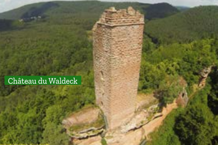
Château du Waldeck